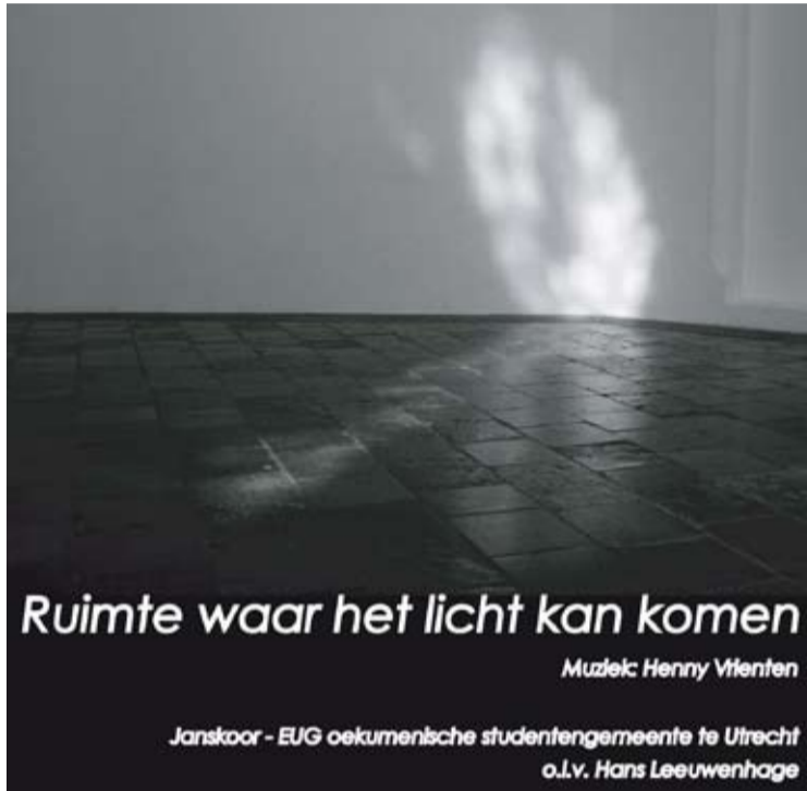
* De omslag van het cd-boekje met liturgische muziek van Henny Vrienten.